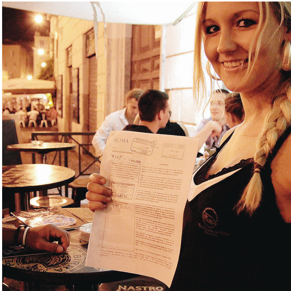
GIRO DI VITE Una barista di Campo de' Fiori con l'ordinanza antialcol